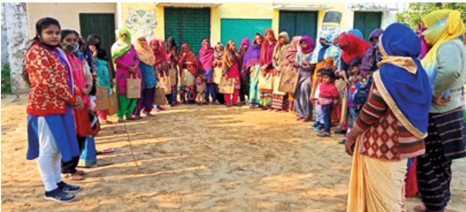
Reading competition organised in Upralsi village

A reading competition was organized in village Upralsi of Gautam Buddha Nagar district on 27th December 2021 where in 35 neo-literate learners from seven batches of the SHIKSHA+ program participated. The objective of the activity was to fulfil the need to help neo-literates use and sustain their newly acquired literacy skills to prevent