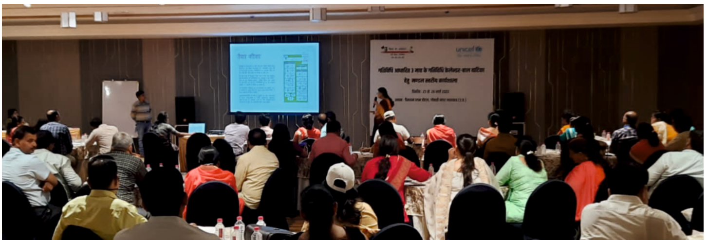
Bal Vatika Mandal Workshop organised by Department of Basic Education