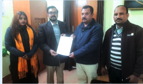
Letter of Intent (LOI) signed with Bulandshahr Jail for SHIKSHA+ batches