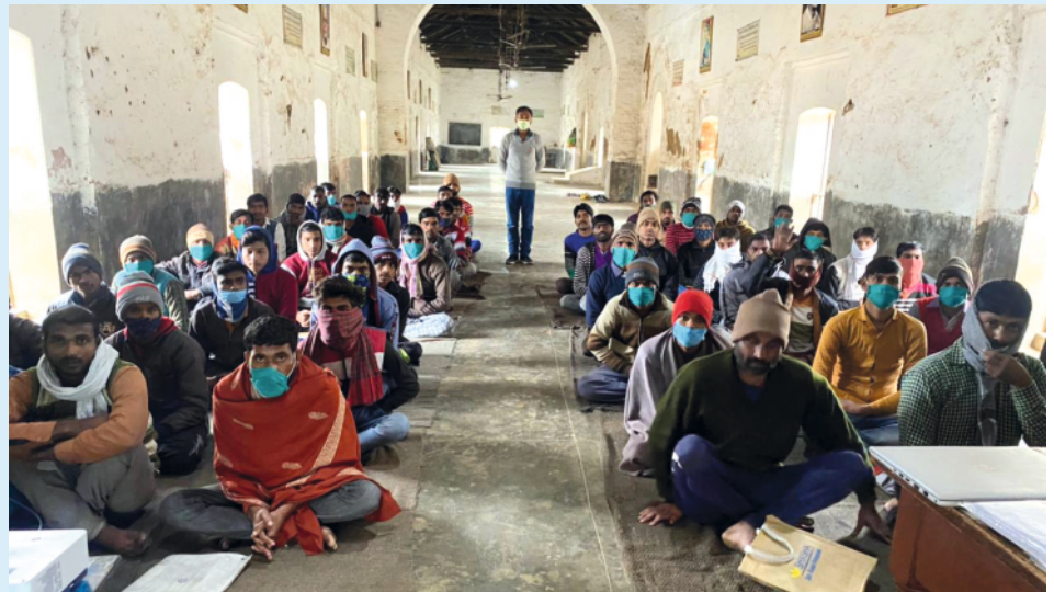
Batch of male learners in Sitapur Jail