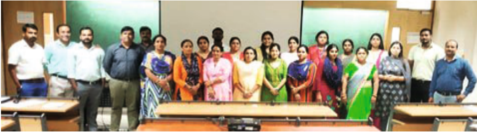
Induction Training for Government and Private Teachers

Shiksha Initiative organized an induction training for elementary teachers of Govt. and private schools from 4th to 6th October 2021 for 40 teachers (36 government and 4 private) in two groups. The objectives of the training program include enabling teachers to become competent in innovatively