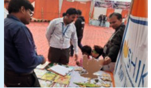
Team SHIKSHA at Kapilvastu Mahotsav in Siddharthnagar

विकासखण्डों से आये हुये डायट प्रवक्ता ए.आर.पी.एस.आर.जी. परिषदीय प्राथमिक एवं उत्तर माध्यमिक विद्यालयों के आये हुये शिक्षक-शिक्षिकायें, ग्रामीण एवं शहरी अंचलों से पधारे काफी संख्या में आगन्तुकों ने जानकारी प्राप्त करते हुये संस्था का उत्साहवर्धन किया। शिव नाडर फाउण्डेशन ने विभिन्न प्रचार प्रसार सामग्री के साथ साथ स्टॉल में आई.सी.टी. उपकरणों के विभिन्न प्रकार जैसे लैपटाप, प्रोजेक्टर एवं अन्य सहायक उपकरणों का भी प्रदर्शन किया एवं आने वाले आगन्तुकों को संस्था प्रतिनिधियों के द्वारा स्मार्ट क्लास के संचालन हेतु इसकी उपयोगिता एवं प्रासंगिकता पर भी प्रायोगिक चर्चा कर जानकारी प्रदान की गयी। शिव नाडर फाउण्डेशन के एल.ई.डी. के माध्यम से स्मार्ट कक्षाओं से संबंधित कोटेंट का भी प्रदर्शन किया गया। इस अवसर पर समाज के सभी वर्गों की सक्रिय सहभागिता का अवलोकन किया गया।