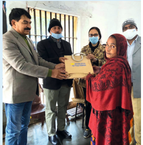
Learner Kit distribution program held at Sitapur Jail