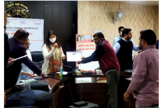
Team SHIKSHA receiving certificate of appreciation for their contribution towards Aspirational District program

In this regards, Piramal Foundation invited SHIKSHA Initiative along with other development partners and appreciated their contribution in the development of aspirational districts