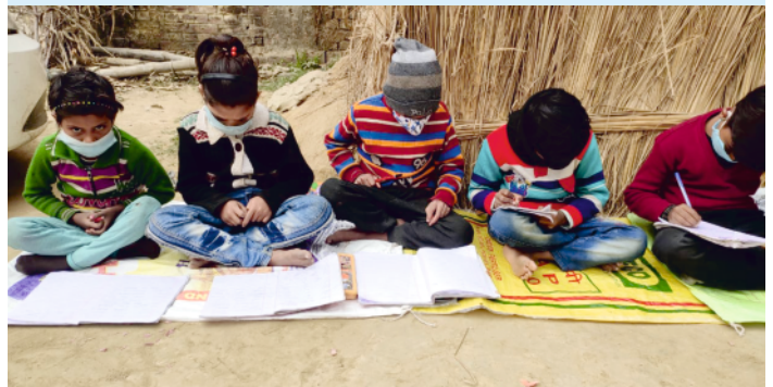
SHIKSHA Ki Goonj