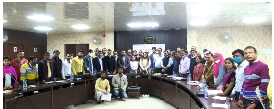
SHIKSHA Initiative along with other development partners