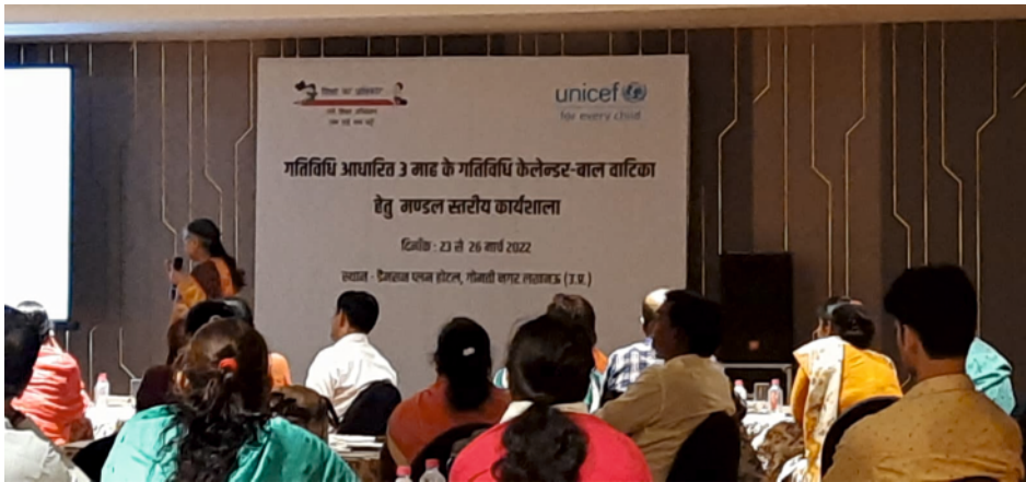
Bal Vatika Mandal Workshop organised by Department of Basic Education

The Pre-Primary Cell in the UP-govt. Department of Basic Education established model Bal Vatika's in every block of each district in all the administrative divisions of Uttar Pradesh. The department acknowledged the success of