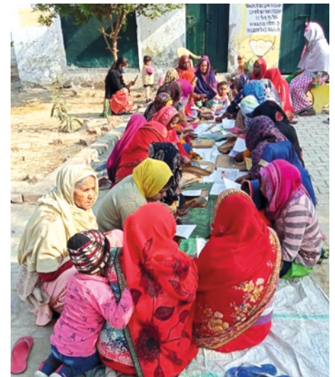
Learners actively participating in reading competition.

'rusting' by creating a learning environment. It also motivated learners to start reading books and continue the practice. Shiksha Initiative aims at creating lifelong learners and an activity like this helps in achieving the vision. The books were selected after the detailed research and study. To acknowledge the efforts and develop a healthy spirit of reading, the