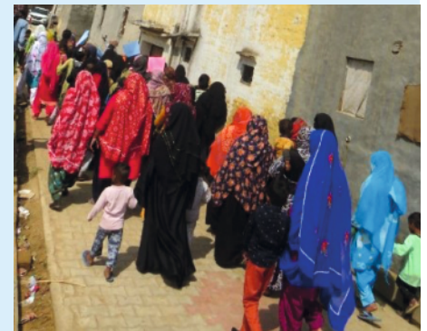
Women's day celebration held across SHIKSHA+ batches